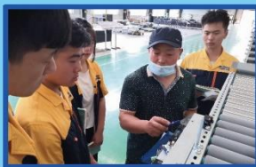
专业教师讲解辊道机