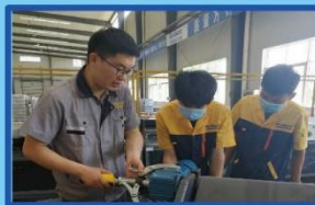
培训师讲解皮带机