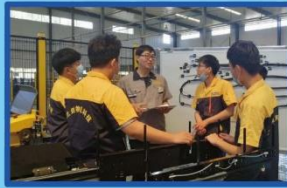
工艺员讲解穿梭车线束制作